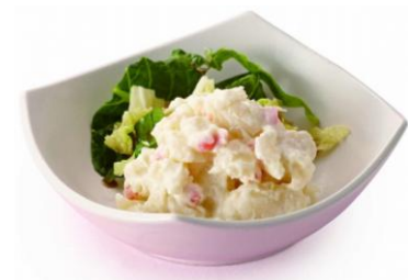
▲ポテトサラダ小鉢