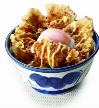
▲ポテマヨ鶏天丼（半熟玉子付き）