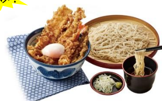
▲大江戸天丼サービスセット(小そば)