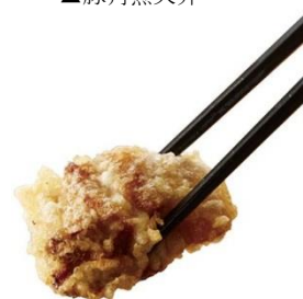
▲豚角煮の天ぷら(単品)