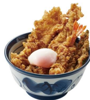
▲大江戸天丼(半熟玉子付き)