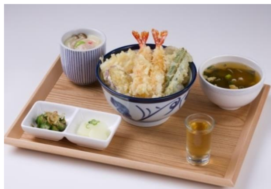
てんや天丼膳 250 元