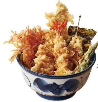
穴子とめごちの天井