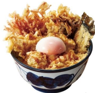
阿波尾鶏天井(半熟玉子付き)