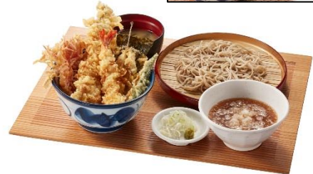
▲穴子とめごちの天井 冷やしおろしそばサービスセット