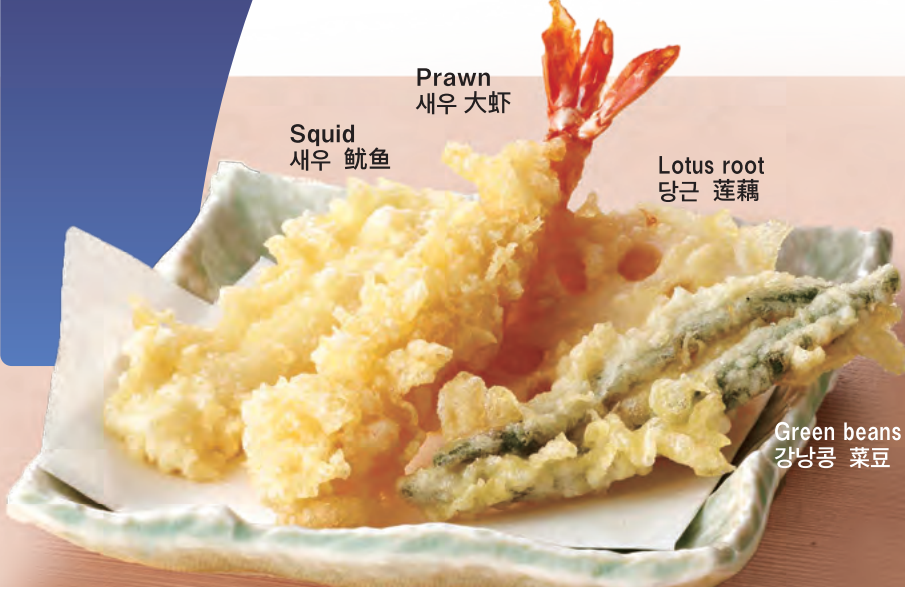
Squid 새우 鱿鱼

※일본술은 점포에 따라 겻케이칸 또는 스이신 중의 하나입니다. ※酒为月桂冠或醉心, 各店不同.