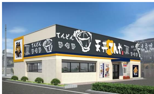
店舗外観イメージ