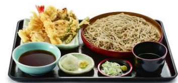
▲「オールスター天そば」840円

揚げたての天ぷらと二八そばが楽しめる一品。〈海老定番人気の〉のほか、魚介の〈大イカ〉と〈ほたて〉、野菜天ぷら〈まいたけ〉、〈れんこん〉、〈いんげん〉がセットになり、人気の天ぷらを一度に味わえます。