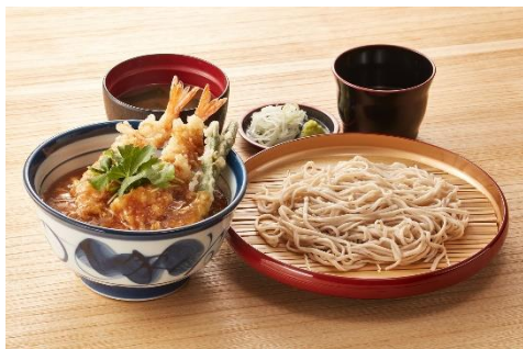
『あんかけ海老天丼サービスセット』1,000円

サクッとした歯触りの海老2本に鮮やかなとろっと玉子をふんわりとかけた天丼です。かつお節とこんぶの合わせだしの旨みを感じてください。