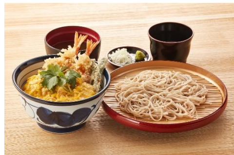
『とろっと玉子の海老天丼サービスセット』1,000円

小そば（または小うどん）が通常価格より40円お得にお召し上がりいただける、あんかけ海老天丼とのセットメニューです。