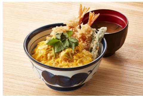
『とろっと玉子の海老天丼』790円

サクッとした歯触りの海老2本に、てんやオリジナル「特製和風あん」で楽しんでいただく天丼。やさしいかつお節だしの香りが特長です。